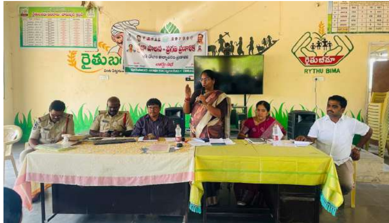
చౌటుప్పల్, జూన్ 4, హైదరాబాద్ మిర్సర్.