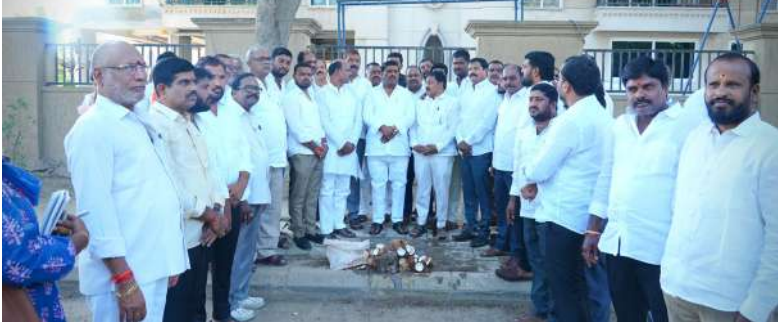
పటాన్చెరు, హైదరాబాద్ మిర్సర్ ప్రతినిధి జూన్ 04:

కర్ణనూరులో సీసీ రోడ్డు, తెల్లపూర్లో రూ.87 లక్షల అభివృద్ధి పనులకు శంకుస్థాపన