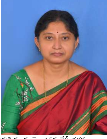
ప్రక్రియ ఈ నెల 15వ తేదీ వరకు కొనసాగుతుంది, విద్యార్థులు తారా ప్రభుత్వ కళాశాలకు మొదటి ప్రాధాన్యత ఇచ్చి ప్రవేశాలు పొందాలని ప్రిన్సిపల్ కోరారు. ఏవైనా సందేహాలు ఉంటే నేరుగా కళాశాలను సంప్రదించాలని సూచించారు.

పాటు ఉపాధి అవకాశాలను పెంచే బీకాం, బీబీఏ, రిజర్వేషన్, బీకాం హెచ్ఆర్, బీబీఏ, రిజర్వేషన్, బీకాం హెచ్ఆర్, అందుబాటులో ఉన్నాయని తెలిపారు. అనుభవజ్ఞులైన అధ్యాపక బృందం ద్వారా నాణ్యమైన విద్య అందిస్తున్నామన్నారు. విద్యార్థులకు ఎన్ఎస్సీ, ఎన్ఎస్ఎస్, క్రీడలు, ఆధునిక ప్రయోగశాలలు, కంప్యూటర్ ల్యాబ్లు, జిమ్, విస్తృత గ్రంథాలయ సదుపాయాలు అందుబాటులో ఉన్నాయని వివరించారు. అలాగే ఎస్సీ, ఎస్టీ, బీసీ, మైనారిటీ విద్యార్థులకు ప్రభుత్వ స్కాలర్షిప్లు లభిస్తాయని తెలిపారు. ప్రభుత్వ పాఠశాలలు, కళాశాలల్లో చదివిన బాలికలకు అజీమ్ ప్రీమ్జీ ఫౌండేషన్ ద్వారా సంవత్సరానికి రూ.30 వేల స్కాలర్షిప్, అలాగే మలబార్ గోల్డ్ స్కాలర్షిప్ కింద రూ.10 వేల వరకు ఆర్థిక సహాయం అందుబాటులో ఉందన్నారు. దోస్తూరు మాడో దశ ఆడిషన్లు