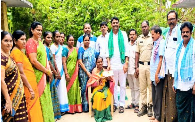
మంగపేట, జూన్ 08, హైదరాబాద్ మిరర్