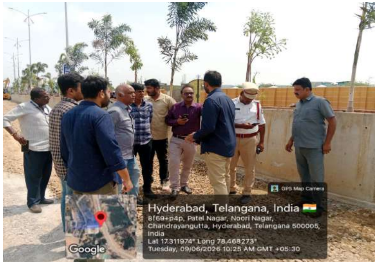
గండిపేట్ : (హైదరాబాద్ మిరర్)

- అభివృద్ధి పనులను వేగవంతంగా పూర్తి చేయాలి