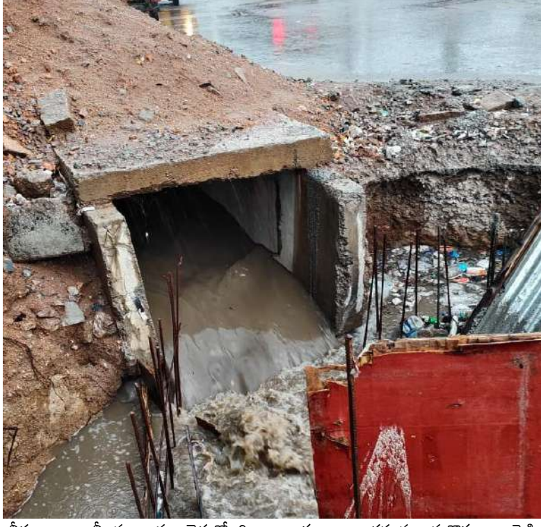
నీరంతా కాలనీలను ముంచెత్తోంది. ఒక శాఖ తప్పును మరొక శాఖపైకి

నెడుతూ కాలయాపన చేయడంలోనే అధికారులు కాలం గడిపిస్తున్నారని స్థానిక ప్రజలు వాపోతున్నారు.