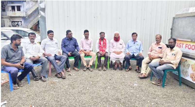
తాండూరు, జూన్ 09 (హైదరాబాద్ మిర్సర్):

నిందితులపై హత్యా కేసు నమోదు చేయాలి - బీసీలపై దౌర్జన్యాలను అరికట్టాలి