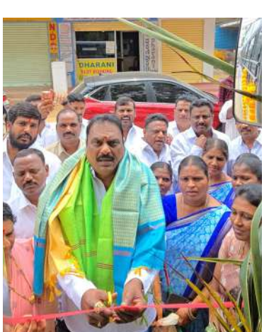
గండిపేట్ : (హైదరాబాద్ మిరర్)

మహిళలను ఆర్థికంగా స్వావలంబులుగా తీర్చిదిద్దే దిశగా తెలంగాణ ప్రభుత్వం మరో కీలక అడుగు వేసింది. మహిళా స్వయం సహాయక సంఘాలకు ఆర్టీసీ బస్సులను అద్దె ప్రాతిపదికన నడిపించే అవకాశాన్ని కల్పిస్తూ ప్రభుత్వం అమలు చేస్తున్న వినియోగ పథకంలో భాగంగా రాష్ట్రవ్యాప్తంగా 400 సరికొత్త బస్సులను ప్రారంభించింది. ఈ మహాత్మర కార్యక్రమంలో భాగంగా శంషాబాద్ లో