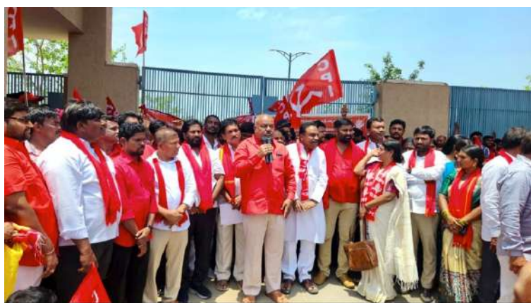
హక్కులు కల్పించాలని డిమాండ్ చేశారు. ప్రజల సమస్యల పరిష్కారానికి ప్రభుత్వం తక్షణ చర్యలు తీసుకోవాలని, లేకపోతే సిపిఐ ఆధ్వర్యంలో ఉద్యమాలను మరింత ఉద్ధృతం చేస్తామని పాలమాకుల జంగయ్య హెచ్చరించారు. ఈ ధర్నాలో సిపిఐ రాష్ట్ర, జిల్లా నాయకులు, కార్యకర్తలు పెద్ద సంఖ్యలో పాల్గొని ప్రభుత్వానికి వ్యతిరేకంగా నివాదాలు చేశారు.

అమాంతం పెరిగి ప్రజల జీవనం దుర్భరంగా మారిందన్నారు. పేదలకు సబ్సిడీ రేషన్ సరుకులు అందించాలని, మార్కెట్లో నల్లబజారు, కృత్రిమ కొరత సృష్టిస్తున్న వ్యాపారులపై కఠిన చర్యలు తీసుకోవాలని డిమాండ్ చేశారు. అర్జున ప్రతి పేద కుటుంబానికి ఇందిరమ్మ ఇంట్ల మంజూరు చేసి గృహ సమస్యను పరిష్కరించాలని ప్రభుత్వాన్ని కోరారు. అబ్దుల్లాపూర్ మండలం కుంటూరు రెవెన్యూ పరిధిలోని భూదాన భూముల్లో గుడిసెలు వేసుకుని నివసిస్తున్న కుటుంబాలకు జనగణన నిర్వహించి, విద్యుత్, మంచినీరు, రవాదారులు వంటి మౌలిక సదుపాయాలు కల్పించాలని కోరారు. అలాగే చేపెళ్ల, మహేశ్వరం, కొడగూరు, చౌదరిగూడ ప్రాంతాల్లో పేదలకు మంజూరైన ఇళ్ల స్థలాల పట్టాలకు అనుగుణంగా భూములపై