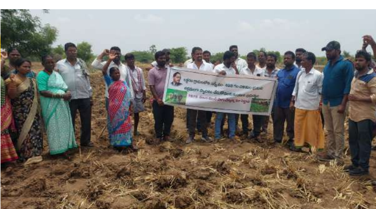
దళిత రైతులకు న్యాయం చేయాలి

నిర్వహించకుండా, ప్రజాభిప్రాయం తీసుకోకుండా పనులు ప్రారంభించేందుకు ప్రయత్నించడం ప్రజాస్వామ్య సూక్తికి విరుద్ధమని విమర్శించారు. గతంలో ఆమీన్లూర్ ప్రాంతంలో వ్యతిరేకత ఎదుర్కొన్న ప్రాజెక్టును ఇప్పుడు లక్షారం గ్రామ భూముల్లో అమలు చేయాలని అధికారులు ప్రయత్నిస్తున్నారని ఆరోపించారు. గ్రామ పరిసర ప్రాంతాల్లో ఇప్పటికే కంకర క్రషర్లు, కృత్రిమ ఇసుక తయారీ కేంద్రాలు, అక్రమ మట్టి, ఇసుక రవాణా కారణంగా కాలుష్య సమస్యలు తీవ్రంగా ఉన్నాయని గ్రామస్థులు తెలిపారు. వేలాది డిపార్ట్