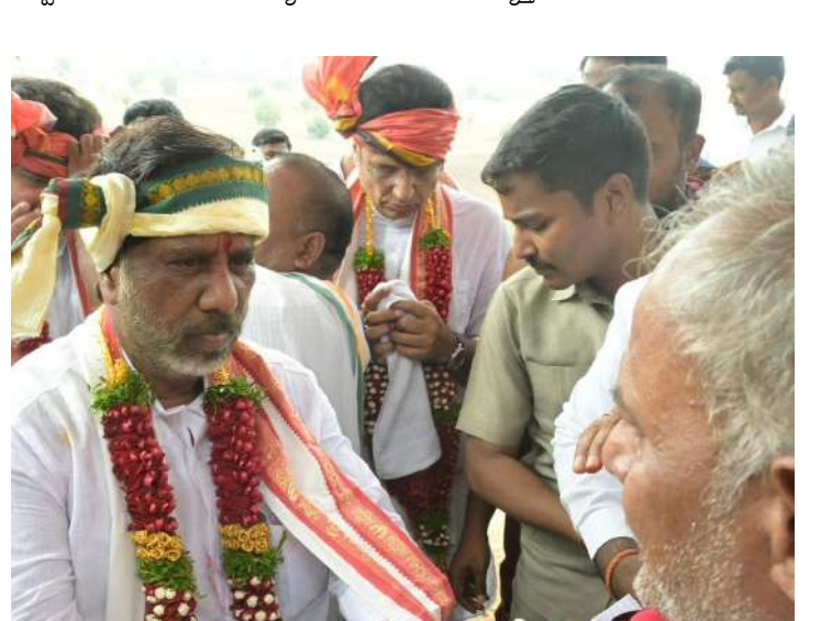
గూడెం సత్యనారాయణ స్వామి ఆలయ పునర్నిర్మాణం మంత్రులతో కలసి శంకుస్థాపన చేసిన భట్టి