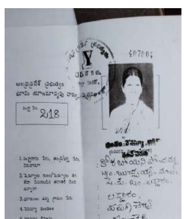
పరిష్కారం చూపాలని విజ్ఞప్తి చేశారు.

చట్టబద్ధమైన న్యాయం, తగిన పరిహారం లేదా ప్రత్యామ్నాయ భూమి కల్పించడం ప్రభుత్వ బాధ్యత అని అన్నారు. రైతుల సమస్యలను అధికారులు పునఃసమీక్షించి, వారితో చర్చించి న్యాయబద్ధమైన