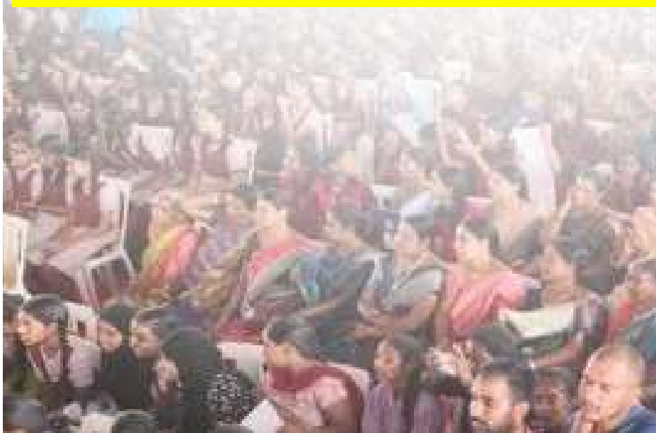
రంగారెడ్డి, జూన్ 17 (హైదరాబాద్ మిరర్):

ప్రభుత్వ పాఠశాలల ద్వారా మళ్లీ మాణిక్యాలను వెలికితీసామని ముఖ్యమంత్రి రేవంత్ రెడ్డి అన్నారు. సమాజంలో అసమానతలు పోవాలంటే అందరికీ నాణ్యమైన విద్య అవసరమని చెప్పకొచ్చారు. ప్రభుత్వ బడుల్లో చదివి ఐపిఎస్, ఐఏఎస్, సీఎంఎలు అయినవాళ్లు ఉన్నారన్నారు. ప్రభుత్వ పాఠశాలల్లో చదవటం నామోషీ అనే ఆలోచన పోవాలని అన్నారు. బుధవారం రంగారెడ్డి జిల్లాలోని ఆరుట్లలో తెలంగాణ పబ్లిక్ స్కూల్స్ను సీఎం ప్రారంభించారు.