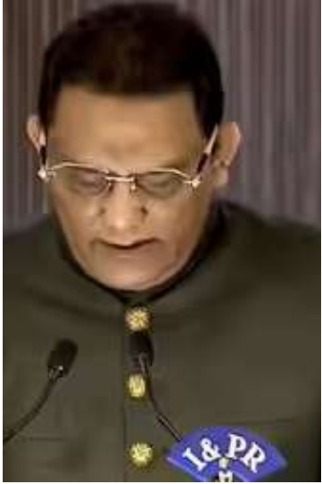
హైదరాబాద్, జూన్ 17 హైదరాబాద్ మిరర్:

► బెంగాల్, బాహార్ లో ఇందుకు నిదర్శనం ► మీడియాతో మంత్రి అజారుద్దీన్ వ్యాఖ్య