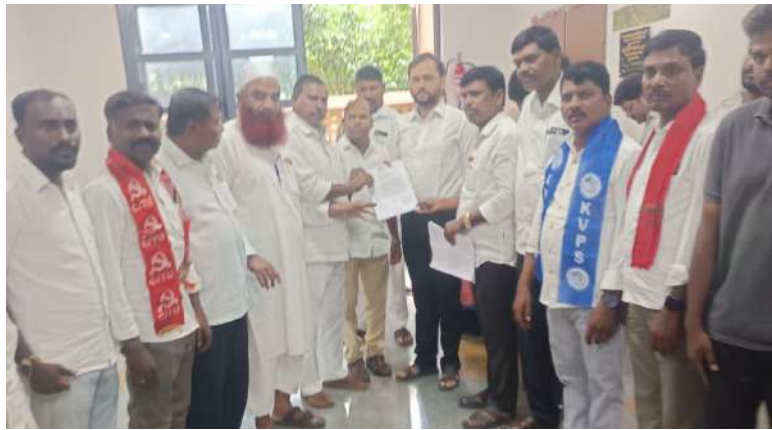
వికారాబాద్, జూన్ 17 (హైదరాబాద్ మిర్సర్):

మెడికల్ రిపోర్ట్ లను తారుమారు చేసి ఆధారాలు లేవని బుకాయిస్తున్న పోలీసులు