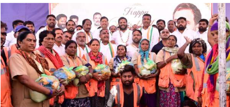
పటాన్చెరు, హైదరాబాద్ మిర్సర్ ప్రతినధి

జిహాచ్ఎంసీ కార్మికులకు నిత్యావసర కిట్లు పంపిణీ