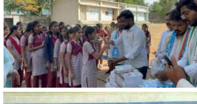
కూకట్ పల్లి, జూన్ 19 (హైదరాబాద్ మిర్సర్):