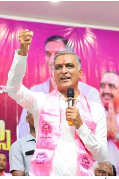
ఆయన బల్ల గుడ్డి ప్రశ్నించారు. దీనిపై చర్చకు ఏ ఊరుకైనా పోదాం వస్తారా అని మంత్రులకు ఆయన సవాల్ విసిరారు.మొత్తం రాష్ట్రంలో 7,600 మందికి బీమా రాలేదని గణాంకాలతో సహా హరీష్ రావు వివరించారు. ఎందుకు బీమా రావడం లేదంటే.. ప్రభుత్వం ప్రీమియం కట్టలేదన్నారు చెప్పారు. ఈ నేపథ్యంలో గురువారం మీరు కేబినెట్ లో చేసిన తీర్మానాన్ని ఉపసంహరించుకోవాలని ప్రభుత్వాన్ని ఆయన డిమాండ్ చేశారు. అన్ని పంటలు యథావిధిగా కొనుగోలు చేయాలని ప్రభుత్వానికి స్పష్టం చేశారు. తప్పుడు నిర్ణయం తీసుకున్నందుకు రైతుల క్రూపాపణ చెప్పాలని రేవంత్ సర్కార్ ను హరీష్ రావు డిమాండ్ చేశారు.

రేవంత్ రెడ్డి ప్రభుత్వం కోస్తుందన్నారు. రైతులు జీవితాలతో కేంద్ర, రాష్ట్ర ప్రభుత్వాల చెలాకాటం ఆడుతున్నారన్నారు. ఎకరాకు రెండు బస్టాల యూరియా మాత్రమే.. అదీ నెలకు ఒకటి చొప్పున ఇస్తారట అంటూ ఆయన ఆందోళన చెందారు. రైతులంటే మీకు ఎందుకు ఇంత చిన్నచూపు అని మంత్రులను ఆయన ప్రశ్నించారు. యూరియా ఇచ్చే తెలివి కూడా లేదా అని ప్రభుత్వాన్ని నిలదీశారు. మిర్సర్ రైతులు ఎకరాకు ఐదారు యూరియా బస్టాలు వాడుతారని.. మరి మీరు రెండే ఇస్తే మిగతాది ఎట్లా అని ప్రశ్నించారు. కేంద్రం 30 శాతం యూరియా ధరలు పెంచినది నివారించారు. రెండు బస్టాల ఆలోచన విరమించుకోవాలని ప్రభుత్వానికి ఆయన హితవు పలికారు. 45 రోజుల్లో 9 వేల కోట్ల రూపాయిల రైతు బంధు ఇస్తామన్నారు.. 90 రోజులు అయ్యిందని.. ఇప్పటికే రైతుల ఖాతాల్లో నగదు మొత్తం పడలేదని విమర్శించారు. ఎకరాకు రూ.15 వేలు అన్నారని చెప్పారు. 2024-25 వానాకాలం పంటల ఒక్క రూపాయి ఇవ్వలేదని.. పూర్తిగా ఎగ్జిజ్టెన్స్ తెలిపారు. లక్షల బంధు కింద కాంగ్రెస్ ప్రభుత్వం మొత్తం 5 పంటలకు రైతులకు రూ.29,358 కోట్లు బకాయి వడ్డిందని అన్నారు. రైతు బీమా ఆగలేదని వ్యవసాయ శాఖ మంత్రి తుమ్మల చెప్పారని గుర్తు చేశారు. మరి ఈ ఏడాది జనవరి నుంచి నేటి వరకు రైతు బీమా ఆగిందా? లేదా చెప్పాలని మంత్రులను