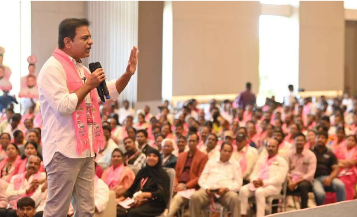
తిరుగుతున్నారని కేసీఆర్ ఎద్దేవా చేశారు. కాంగ్రెస్ అధికారంలోకి వచ్చిన తర్వాత రాష్ట్ర అభివృద్ధి చూస్తున్నారని, కేవలం అప్పులే పెరిగిపోయాయని కేసీఆర్ ఆరోపించారు. ఈ కొద్ది కాలంలోనే ప్రభుత్వం దాదాపు 4 లక్షల కోట్ల రూపాయిల అప్పు చేసినదని పేర్కొన్నారు. హైదరాబాద్ నగరంలో పేదలకు ఒక్క ఇల్లు కూడా కట్టి ఇవ్వలేదు గాని, 'హైదరా' పేరుతో ఉన్న ఇళ్లను మాత్రం నిర్మాణంగా కూల్చుతున్నారని మండి పడ్డారు. కాంగ్రెస్ నాయకులను 'దండుపాళ్ళం ముఠా'తో పోల్చిన ఆయన, ఈ ప్రభుత్వాన్ని ఒక మాఫియా సదువుతోందని, ఆ మాఫియాలో రేవంత్ రెడ్డి ఒక పిల్ల నాయకుడు అని తీవ్ర వ్యాఖ్యలు చేశారు. రాష్ట్రంలో రైతుల పరిస్థితి మరి దారుణంగా తయారైందని కేసీఆర్ ఆవేదన వ్యక్తం చేశారు. ధాన్యం కొనుగోలు చేయడానికి ప్రభుత్వం దగ్గర గోసెంచులు కూడా లేవని, ఆ సంచులన్నీ డిజిటీక్ పోతున్నాయని విమర్శించారు. రైతులకు ఇవ్వాలి 'రైతుబంధు' డబ్బు బండ్ అయిపోయిందని, ఆ పైసలన్నీ రాహుల్ గాంధీ ఖాతాలో 'టింగ్ టింగ్' అని పడుతున్నాయని ఆరోపించారు. ప్రస్తుతం పరిస్థితి ఎంత దారుణంగా ఉందంటే, రైతులు ధాన్యం కుప్పలపైనే

రేవంత్ రెడ్డి అబద్ధాలు చెప్పి, మోసపూరిత వాగ్దానాలతో అధికారంలోకి వచ్చారని బీఆర్ఎస్ వర్కింగ్ ప్రెసిడెంట్ కేసీఆర్ మండిపడ్డారు. ఎన్నికల సమయంలో ఇచ్చిన హామీలను కాంగ్రెస్ ప్రభుత్వం పూర్తిగా విస్మరించినది కేసీఆర్ ధ్వజమెత్తారు. మల్కాజ్ గిరి నియోజకవర్గ కార్యకర్తల సమావేశంలో కేసీఆర్ కాంగ్రెస్ ప్రభుత్వంపై, ముఖ్యమంత్రి రేవంత్ రెడ్డిపై తీవ్రస్థాయిలో విమర్శించారు. కాంగ్రెస్ అధికారంలోకి వచ్చిన ఈ కొద్ది రోజుల్లోనే ప్రజలు పడుతున్న ఇబ్బందులను ప్రస్తావిస్తూ, ప్రభుత్వాన్ని ఒక మాఫియాతో పోల్చారు. ప్రభుత్వం ఏర్పడి ఇన్ని రోజులవుతున్నా ఇచ్చిన గ్యారంటీల ఊసే లేదు. దీనిపై ముఖ్యమంత్రిని ప్రశ్నిస్తే అడ్డమైన తిట్లు తిడుతున్నారు. వంద రోజుల్లో ఏళ్లలు పుడతారా అంటూ వింత మాటలు మాట్లాడుతున్నారని ఎద్దేవా చేశారు. కేసీఆర్ ను తిట్టుకుంటూ తిరిగితే చాలు, పాలన చేయనక్కర్లే అనే చందాన సీఎం వ్యవహార శైలి ఉందని విమర్శించారు. గత ప్రభుత్వం చేసిన పనులకు రిబ్బన్న కట్ చేయడానికి సీఎం తన జేబులో కత్తెర పెట్టుకుని