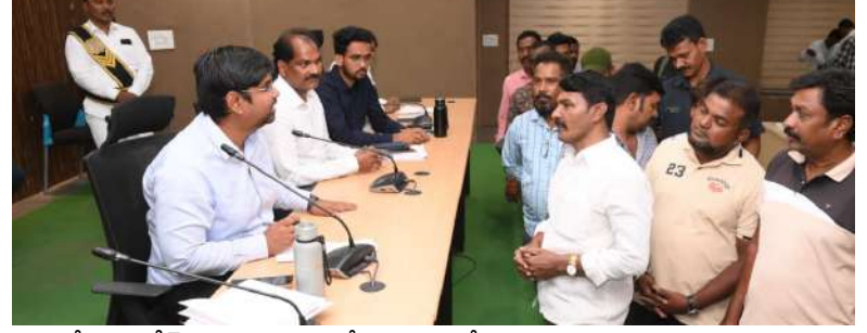
సింగరేణి కాలరీస్ సంస్థ అధ్యక్షులతో కర్మాగారాన్ని పునఃప్రారంభించాలని విజ్ఞప్తి చేశారు. కార్మికులకు రావాల్సిన జీతాలు, భవిష్యనిధి, గ్రాంటు తదితర