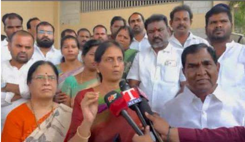
హైదరాబాద్ మిరర్ బాలాపూర్ ప్రతినిధి

ప్రజల అవసరాలే ప్రాధాన్యం... రాజకీయాలు కాదు