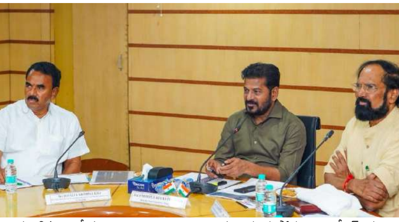
ప్రజాభికలు తీవ్రంగా దెబ్బతింటాయి. తుంగభద్ర జలాలను కర్ణాటక ఇష్టారాజ్యంగా వినియోగించకుండా బచావత్ (ట్రైబ్యూనల్ ఆఫ్ నదిబంధనలను కృష్ణా అవార్డులో పొందుపరచింది. అయినప్పటికీ ఆ నిబంధనలు ఖాతరు చేయకుండా, ఎటువంటి అనుమతులు లేకుండా ట్రిబ్యూనల్ కం బ్యారేజీలను, ఎత్తిపోతల పథకాలను నిర్మించడానికి పూనుకుందన్న ప్రచారం ఉంది. ప్రస్తుతం రాజీవ్ బంద్ ఆనకట్టకు 100 మీటర్ల ఎగువన అక్రమంగా కర్ణాటక నిర్మిస్తున్న కురిడి లిఫ్ట్, చిక్కాపల్లి పర్వత వికాసంలో బ్యారేజీలు పూర్తయితే తెలంగాణ వాటా

అందోళన నెలకొంది. రాయచూర్ జిల్లాలో 2 టీఎంసీల నీటిని తరలింపే కురిడి ఎత్తిపోతల పథకాన్ని రూ. 85 కోట్లతో కర్ణాటక అక్రమంగా నిర్మిస్తున్నట్లు తెలుస్తోంది. సెంట్రల్ వాటర్ కమిషన్ (సీడబ్ల్యూసీ), కృష్ణా రివర్ మేనేజ్మెంట్ బోర్డు (కేఆర్ఎంబీ), తెలంగాణ, ఆంధ్రప్రదేశ్ రాష్ట్రాల అనుమతులు లేకుండానే కర్ణాటక తుంగభద్రపై ఇష్టారాజ్యంగా ప్రాజెక్టులు నిర్మిస్తుందన్న ఆరోపణలు ఉన్నాయి. ఇప్పటికే ఆర్టీఎస్ చివరి ఆయకట్టు రైతులకు సాగునీరు సరిగా అందని పరిస్థితి ఉంది. కర్ణాటక తనకు కేటాయించిన పరిమితులను దాటి అదనపు సాగు చేస్తోంది. ఆర్టీఎస్లో కర్ణాటక వాటా 1.2 టీఎంసీ మాత్రమే. కానీ సగటున 5 టీఎంసీల నీటిని వినియోగిస్తున్నట్లు గణాంకాలు తెలియ జేస్తున్నాయి. కర్ణాటక అక్రమ ప్రాజెక్టుల ప్రభావం కేవలం ఆర్టీఎస్, తుమ్మిళ్ల, భీమా ప్రాజెక్టులకే పరిమితం కాదు. తుంగభద్ర నుంచి శ్రీశైలం జలాశయానికి వచ్చే ప్రవాహాలు తగ్గితే ఉమ్మడి పాలమూరు జిల్లాలోని సాగునీటి ప్రాజెక్టులు కలకత్తి, పాలమూరు రంగారెడ్డి ప్రాజెక్టులతో పాటు తాగునీటి అవసరాలు, భవిష్యత్తు నీటి